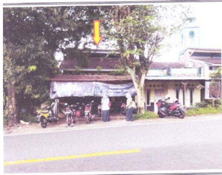
TAMPAK DEPAN PROPERTI