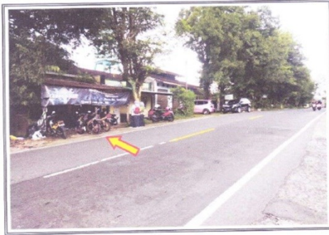
TAMPAK JALAN DEPAN PROPERTI